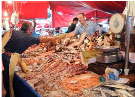
( http://2.bp.blogspot.com/_wF3T2cA9Qc/UxRYij6FEI/AAAAAAAAAYh4-_n_09pGw2us/s1600/1304269491700_b5c03adc8fa2c07b3969a685c4036a4b.jpg )

lunedì, marzo 03, 2014 No comments ( http://www.reporterliveitalia.info/2014/03/nel-piatto-solo-3-pesci-su-10-sono.html#comment-form )